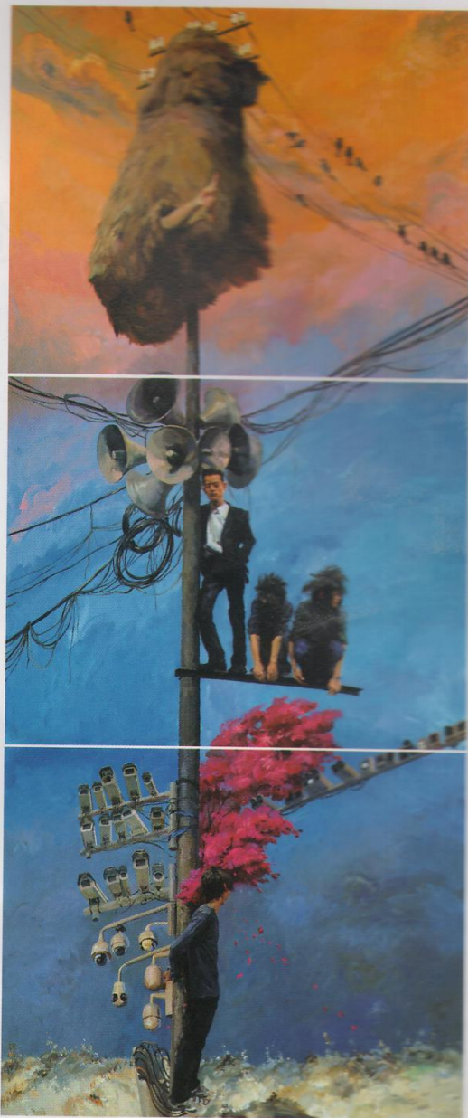
《百尺竿头》，2015，布面丙烯，每联200×250 cm，三联

在喻红写实表象的绘画底下，呈现的是一种超现实的结构或者状态，犹如她的自述：“我们生活在一个很复杂的世界，除了本身所能接触、看到的世界之外，还有许多是通过媒体等媒介来对我们产生很多的影响，这些事件通过传媒的作用到达我们面前，不经意之间影响了我们的思维甚至行动