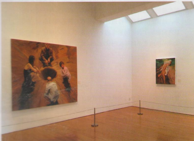
（左）《坤乾》，2015，布面丙烯，2015，180×200cm；（右）《荡漾》；2015，布面丙烯，97×76 cm

若从《坤乾》字面上来解释，乾为“天”在上，代表男性；坤为“地”在下，则代表女性，但《坤乾》颠倒了我们平时常说的“乾坤”，成为坤在上乾在下。对此，喻红解释：“坤为水，往下走，乾为天，往上走，如此世界才能流动交融，否则水在下天在上彼此不交流，就显分离了。”画面中两个身穿类似体操红衣的女孩以一种诡妙的肢体动作，既像倒立又如仰望于画面中，这种配置如同马克·夏加尔（Marc Chagall）1915年作品《生日》中，飘动头部扭曲的自画像，让画面有如被推动而跟着旋转流动了起来，强调《坤