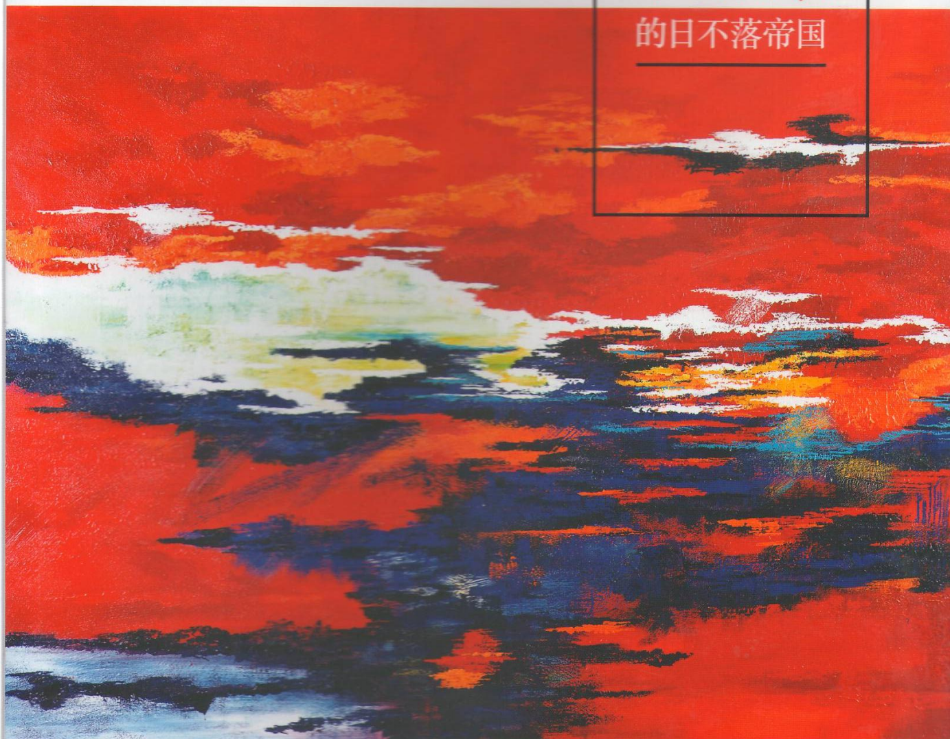
彭雄浑，《光谱_红色 No.1》，亚克力颜料、画布，300×180 cm